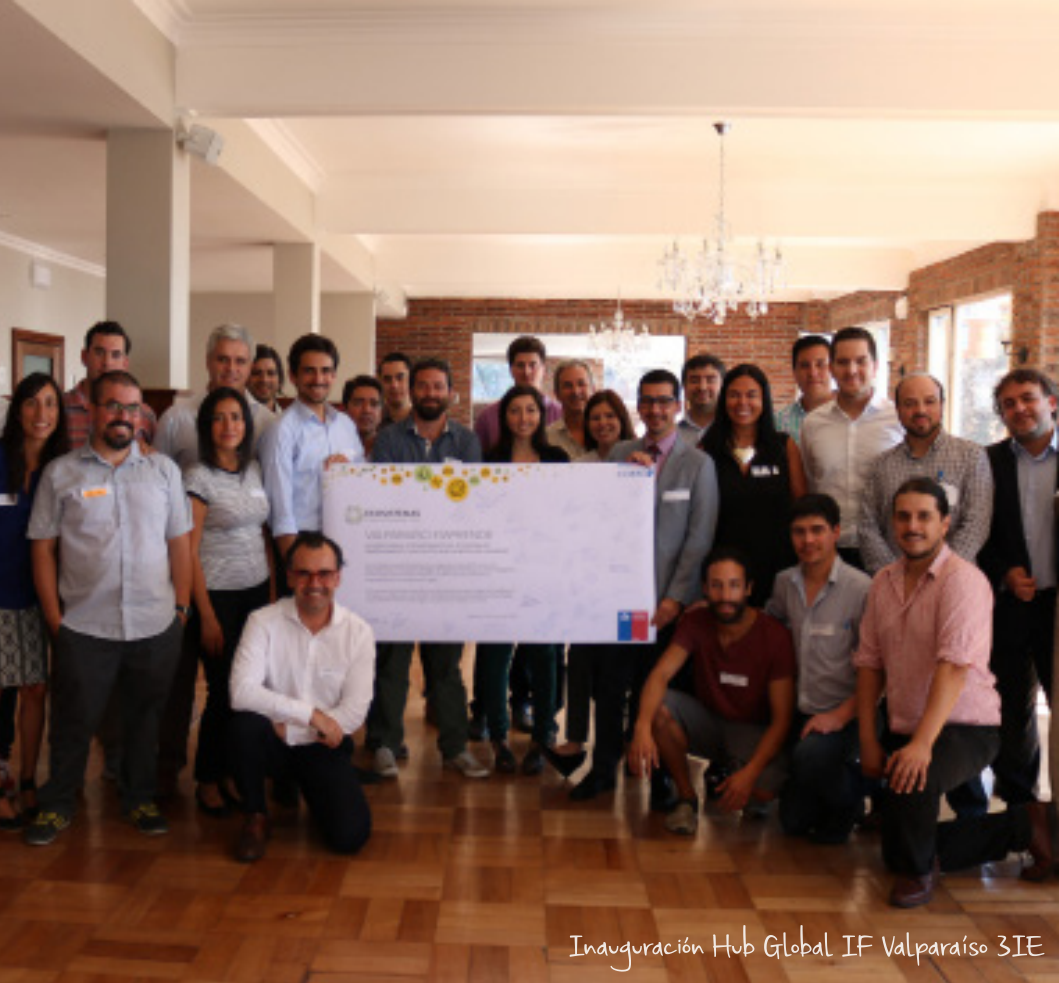
Inauguración Hub Global IF Valparaíso ZIE